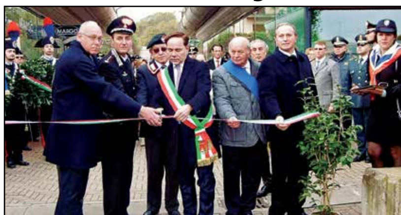
Il taglio del nastro della autorità.